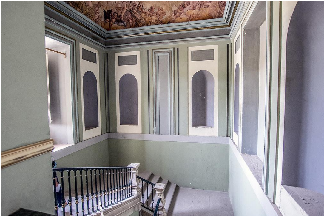
Escalera principal del palacio de Boadilla, en la actualidad.