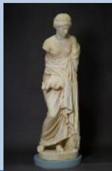
V-033 LEDA Y EL CISNE