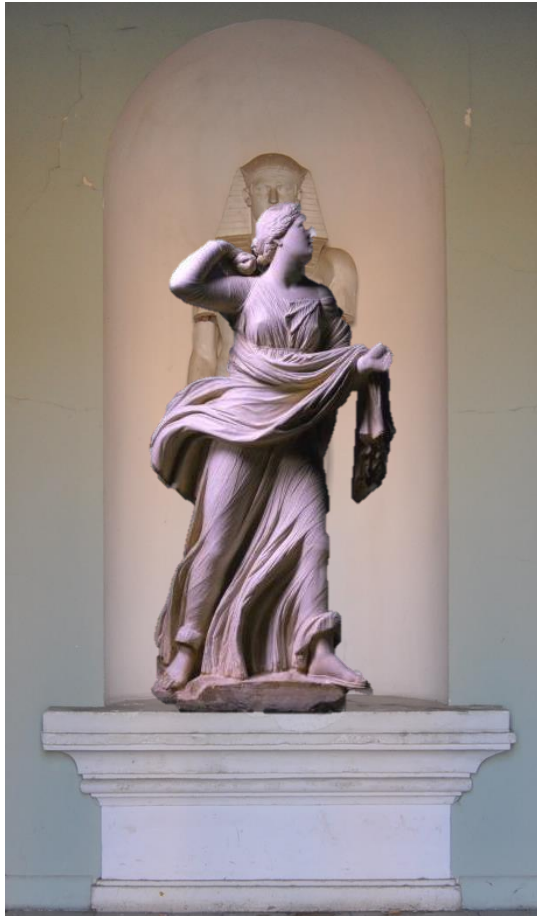
1.- Vestíbulo de entrada principal Medidas 137 ancho x 59 de fondo. Alto pilar 52.

V-039 Nióbide corriendo Dimensiones: 1'76 x 1'00 x 0'55 m