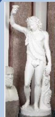
V-063 BACO DE LA TAZA