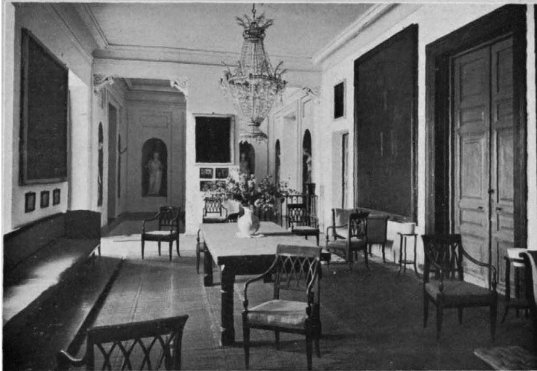
Fotografía de la revista Elegancias (1925), donde el pie de foto dice: escalera con diosas