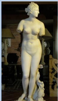
V-076 Venus de Medici. Altura: 159cm