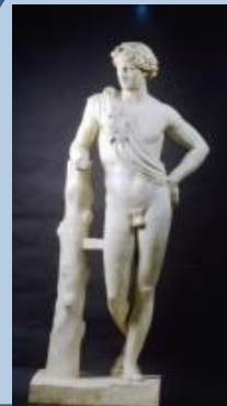
V-054 BACO MEDICI